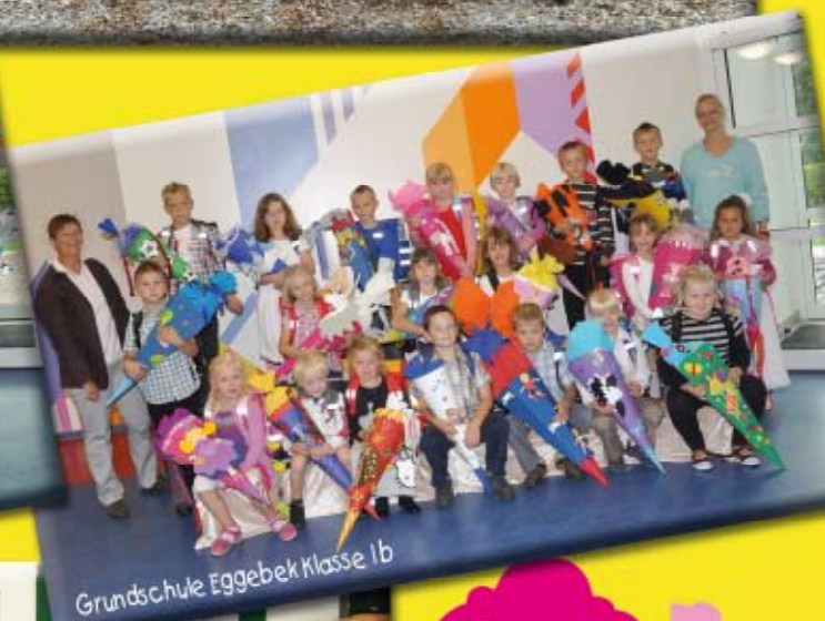
Grundschule Eggebek Klasse 1b