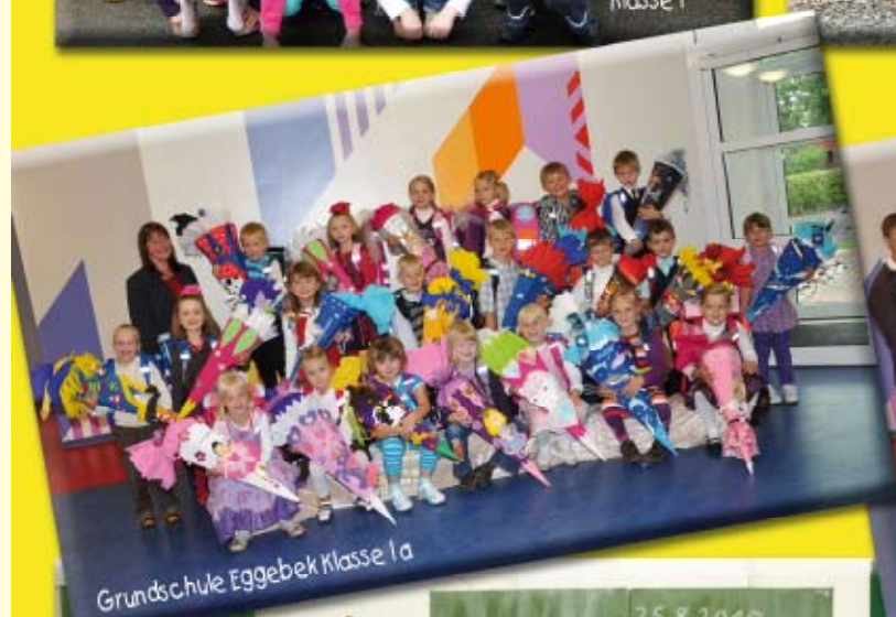
Grundschule Eggebek Klasse 1a