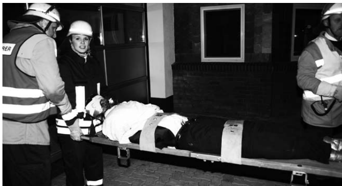
Foto: Die gerettete Person, in diesem Falle eine Puppe, wird abtransportiert.