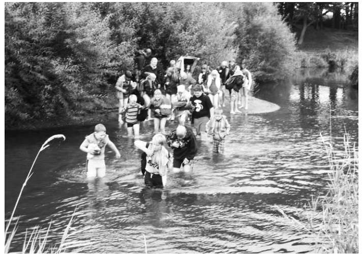
Kostet Überwindung, die Querung der Treene

Alles in allem waren die Kinder von dieser Kennenlernfahrt in Tydal begeistert und würden sich freuen, auch im kommenden Jahr noch