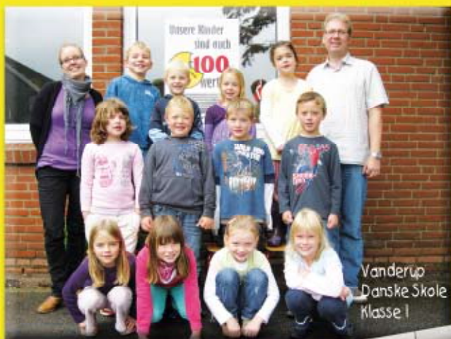
Vanderup Danske Skole Klasse I