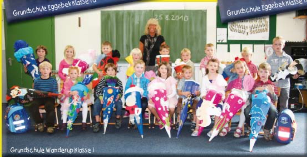
Grundschule Wanderup Klasse I

Allen Schulanfängern wünschen wir viel Erfolg und viel Spaß auf dem neuen Lebensweg!