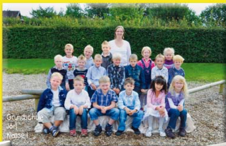
Grundschule Jörl Klasse I