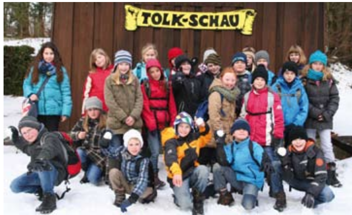
Spaß auch im Winter! Klasse 4 der Grundschule Kleinjörl in der Tolk-Schau