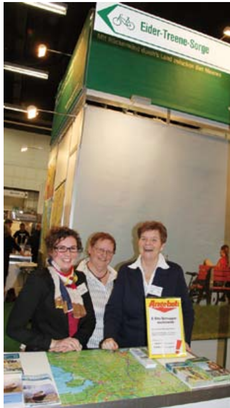
Die Flusslandschaft Eider-Treene-Sorge und Gebietsgemeinschaft Grünes Binnenland gemeinsam auf der „Reisen Hamburg“