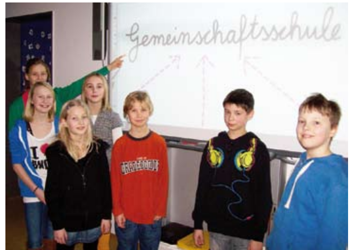
Schülerinnen und Schüler der Klasse 5 b freuen sich auf die zukünftigen 5. Klassen als Gemeinschaftsschüler

Gestützt auf den bisherigen guten Zuspruch blicken Lehrkräfte, Betreuungskräfte und Eltern voller Zuversicht gemeinsam mit ihren fast 500 Schülerinnen und Schülern auf den Start als Grund- und Gemeinschaftsschule und beginnen in den nächsten Wochen mit den entsprechenden Vorbereitungen. Das Amt Eggebek als Schulträger ist ebenfalls sehr optimistisch und unterstützt die Weiterentwicklung in bewährter Weise mit allen Möglichkeiten, die zur Verfügung stehen.