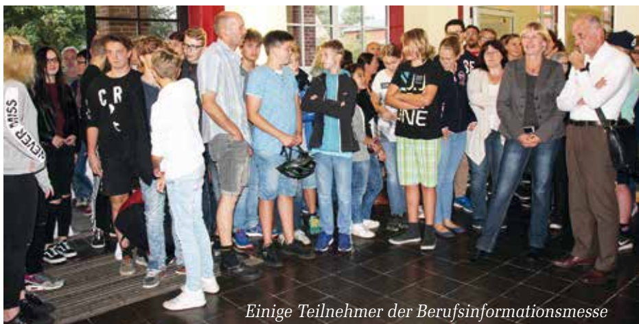
Einige Teilnehmer der Berufsinformationsmesse

Die Eichenbachschule dankt folgenden Unternehmen und Institutionen für ihre Teilnahme: Agentur für Arbeit Flensburg, Aldi Nord, Berufsbildungszentrum Schleswig BBZ, Debeke Tarp, ETHIS Ergotherapie Schleswig, Fielmann, Kreishandwerkskammer SL-FL, Kraftfahrtbundesamt, Landwirtschaftskammer S.-H., Nord-Ostsee Sparkasse, Reisdienst Neubauer, Renault Bent Petersen, Tauwerkfabrik Oellerking Schleswig