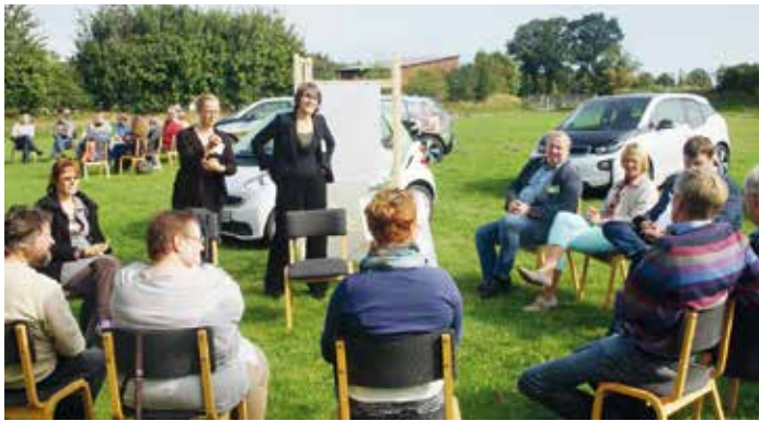
Frische Luft für frische Gedanken: Die Arbeitsgruppen zur nachhaltigen Mobilität fanden im Freien vor Elektroautos statt.