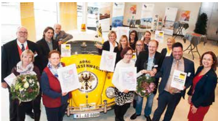
Die Gewinner des ADAC-Tourismuspreises.

22 starke Bewerber gab es auf den ADAC-Tourismuspreis, wovon die besten acht nominiert wurden. Bereits zum zweiten Mal stach die Lokale Tourismusorganisation Eider-Treene-Sorge/Grünes Binnenland aus dieser Gruppe hervor.