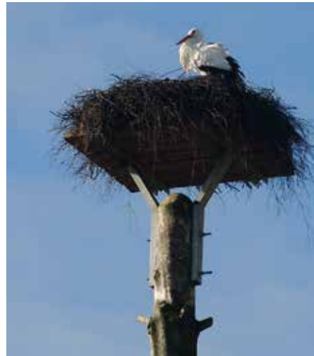
Der Eggebeker Storch hat bereits sein Nest am Klinkenberg bezogen