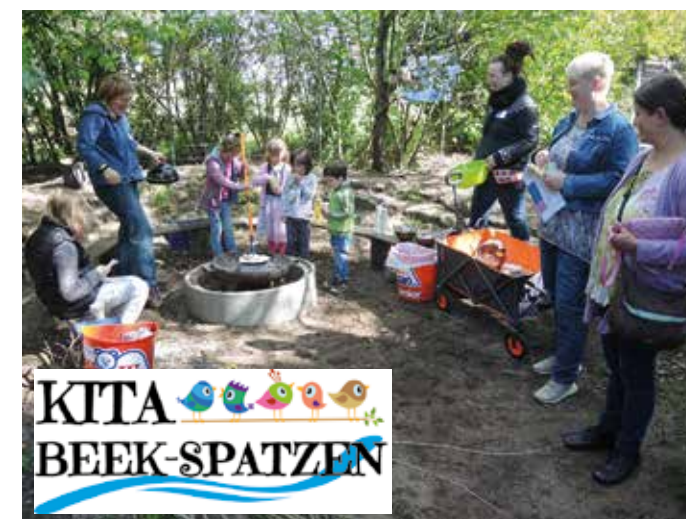
Am Lagerfeuer beim Popcorn machen