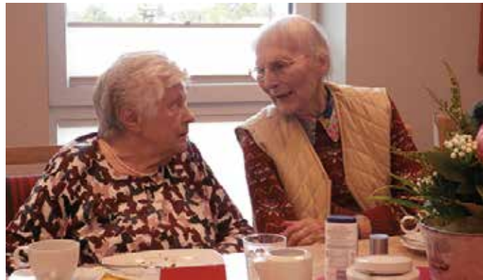
Zwei, die sich nach langer Zeit wiedergefunden haben.

Auch für Frau K. ist die Zeit, die sie hier verbringt, ein Gewinn. „Wer hat sich eigentlich so etwas Tolles für uns ausgedacht“,