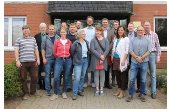
Die Kooperationspartner und Landwirtschaftsfachschüler beim Auftakttreffen.

Aber nicht nur die Weiterentwicklung von Bildungsformaten, sondern auch der Erfahrungsaustausch und die Vernetzung mit der Praxis sind zentrale Bestandteile des Projekts. Fachliche Unterstützung bringen Projektpartner wie die Klimaschutzmanager des Kreises Rendsburg-Eckernförde und der Region Flensburg, der Verein „Boben Op“ aus Hürup, die Abfallwirtschaft Rendsburg-Eckernförde und das Akteursnetzwerk „Innovative Kompostsysteme Bodenfruchtbarkeit“ mit ein. Beim Auftakttreffen der Projektpartner präsentierten Landwirtschaftsfachschüler des Schwerpunktes ökologischer Landbau die Ergebnisse einer Umfrage unter Mitschülern, die sich der entstehenden ökologischen und ökonomischen Probleme durchaus bewusst sind und Unterstützung bei der Bewältigung erwarten. Passende Antworten darauf müssen aber auf allen gesellschaftlichen Ebenen gesucht werden. Hier setzt Projekt „Klimaanpassung als landwirtschaftliches Bildungsmodul“ an und hofft auf weitere sektorenübergreifende Kooperationspartnerschaften.