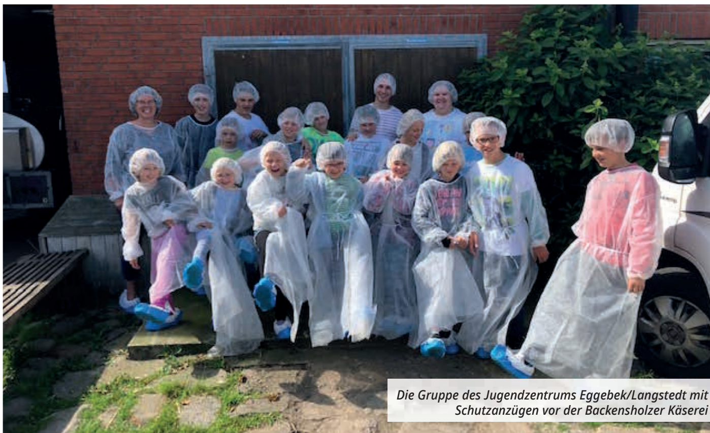
Die Gruppe des Jugendzentrums Eggebek/Langstedt mit Schutzanzügen vor der Backensholzer Käserei