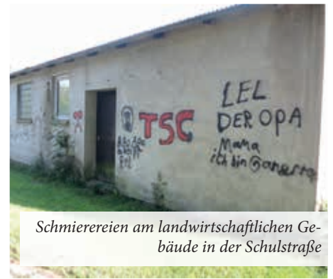
Schmierereien am landwirtschaftlichen Gebäude in der Schulstraße

Thomas Franzen als Bauausschussvorsitzender berichtete über die Neubelegung der Schwarzdecken im Kirchenweg und Achtert Holt durch den Schwarzdeckenunterhaltungsverband. Die Banketten wurden stellenweise durch die Gemeinde angeglichen. Die ersten Spielgeräte, Kletterreck und Schaukelkombination, sind bestellt und werden nach Lieferung im September zügig auf dem Spielplatz an der gemeindlichen Gaststätte aufgestellt. Im nächsten Jahr wird der Spielplatz durch weitere Geräte komplett erneuert.