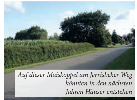
Auf dieser Maiskoppel am Jerrisbeker Weg könnten in den nächsten Jahren Häuser entstehen