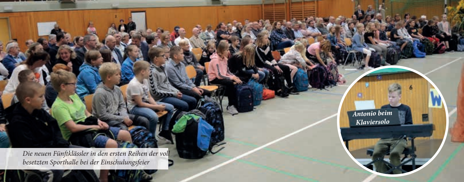
Die neuen Fünftklässler in den ersten Reihen der voll besetzten Sporthalle bei der Einschulungsfeier