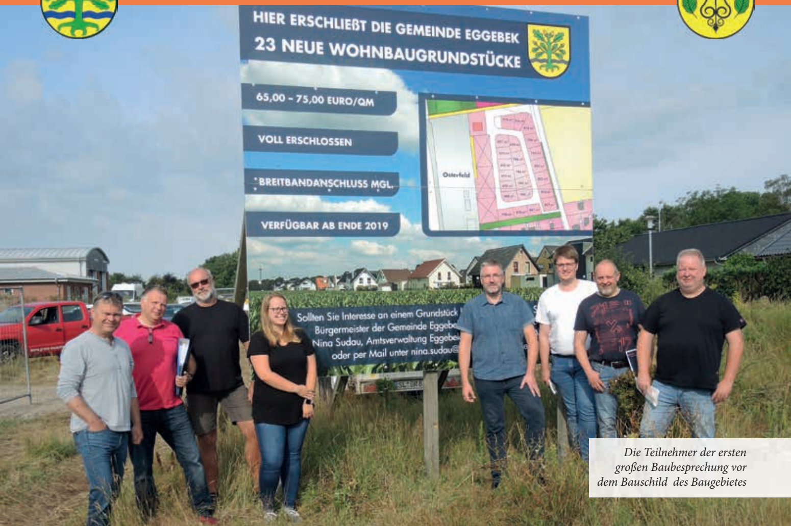
Die Teilnehmer der ersten großen Baubesprechung vor dem Bauschild des Baugebietes