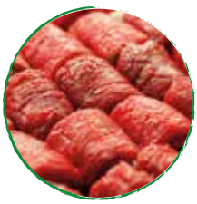
1 kg Rouladenfleisch in dünnen Streifen