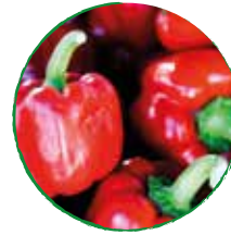
1 rote Paprika gewürfelt