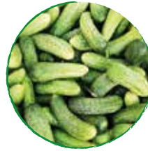
4 Gewürzgurken gewürfelt