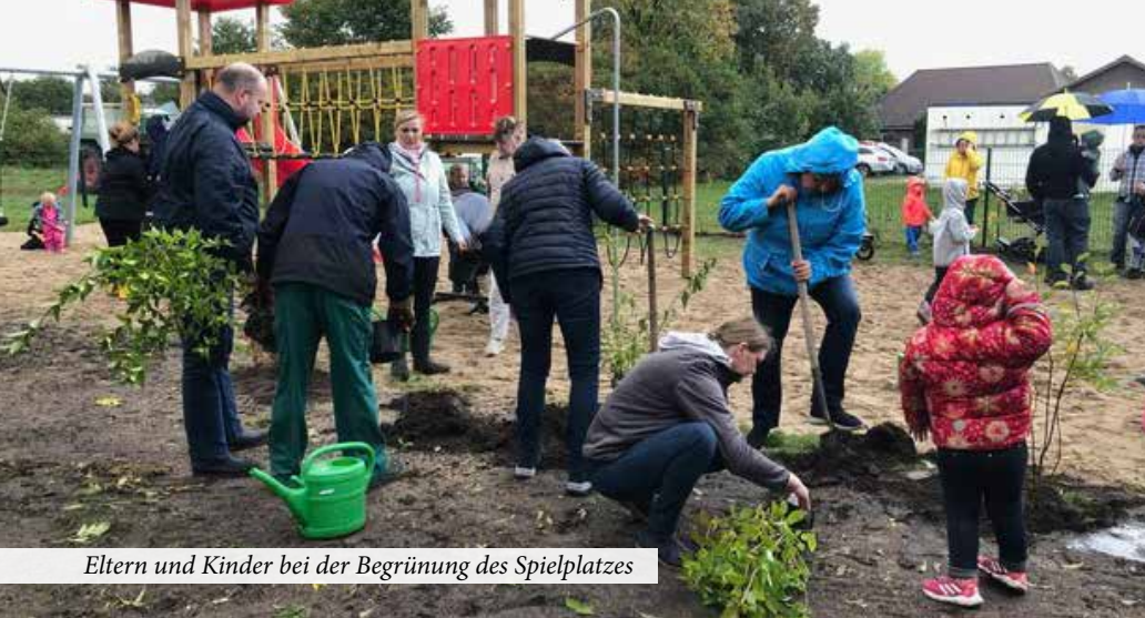
Eltern und Kinder bei der Begrünung des Spielplatzes