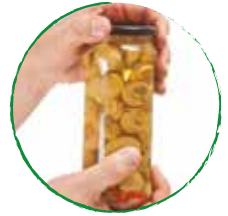
1 Dose Pilze gewürfelt

Außerdem: 1 TL Paprikapulver, 1 gestrichener EL Senf, 6 EL Tomatenmark, 1 l Brühe, Kräuter nach Wahl und Crème fraîche