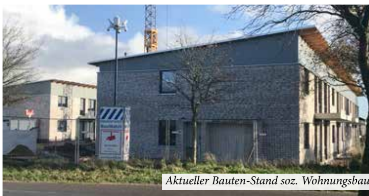
Aktueller Bauten-Stand soz. Wohnungsbau

wesentlich günstigere Erstellung einer Gestaltungs- und Erhaltungssatzung zurückgreifen. In der nächsten Sitzung der Gemeindevertretung in diesem Monat dürfte das weitere Vorgehen