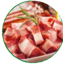
250g Schinkenspeck gewürfelt